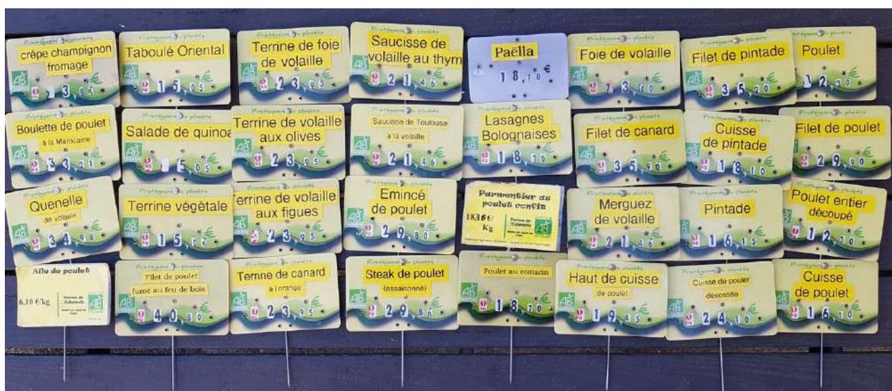
FIGURE 1 – Etiquettes produits de la ferme de Valensol.